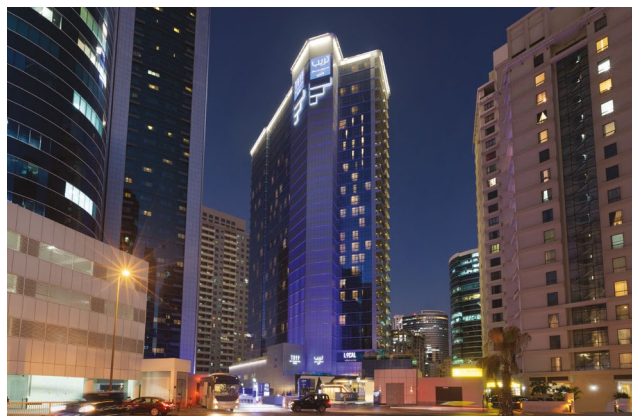
Hotel Tryp by Wyndham

Premium Room Sea View: spaziosa e luminosa, con balcone affacciato sulla piscina e sull'isola di Palm Jumeirah.